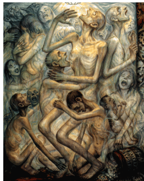
Document 2. David Olère, « Gazage »