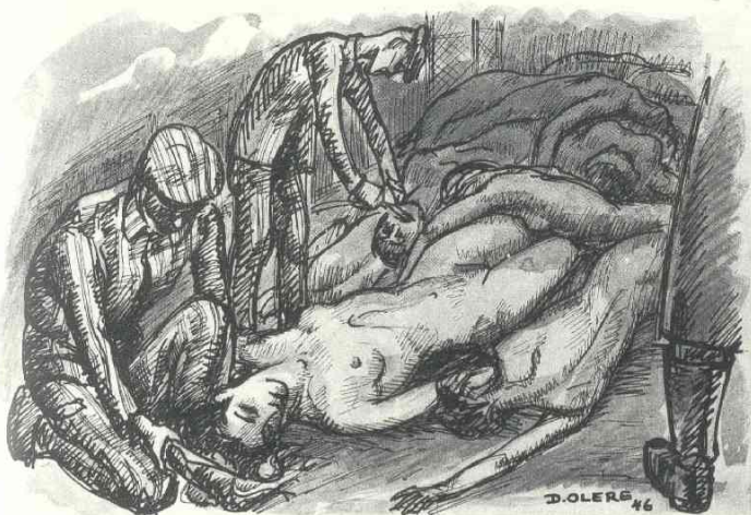
Document 3. David Olère, « Nos cheveux, nos dents et nos cendres »