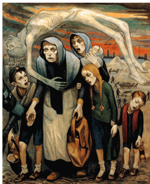
Document 1. David Olère, « Inaptes au travail »