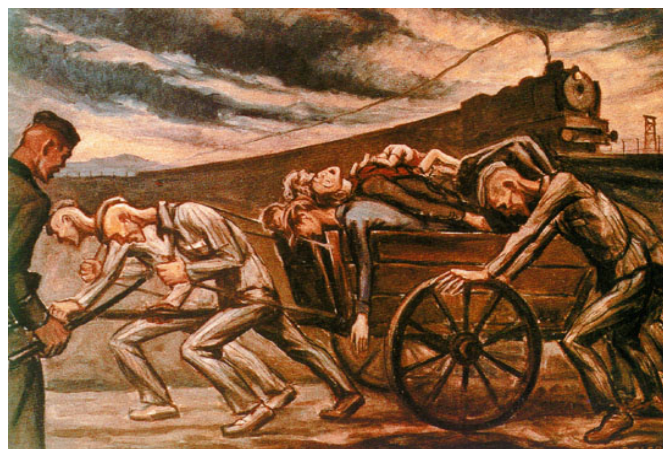
Document 4. David Olère, « Arrivée d'un convoi et charrette transportant des cadavres retirés d'un précédent convoi »